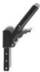
Oparice składane w połowie, do tyłu