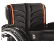
Tapicerka EXO PRO oddychająca