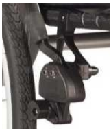
Hamulec na wys. kolan