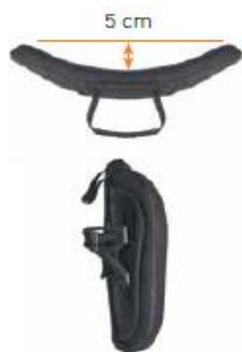
Oparcie Jay 3 płytki kontur