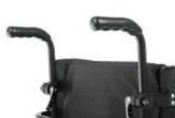
Uchwyt z regulacją wysokości