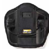
Oparcie Jay Zip