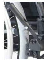
Hamulec jednoręczny, prawy