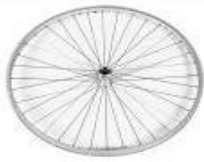
Koło z polerowaną piastą, 36 szprych, splot prosty