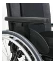
Podłokietnik z pełną osłoną z reg. wysokości, zdejmowany