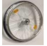
Koło z ham. bębnowym, 36 szprych, splot krzyżowy