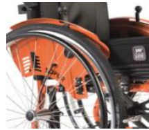
Hamulec zintegrowany z osłoną boczną, Safari