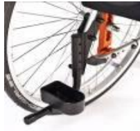
Uchwyt na kule