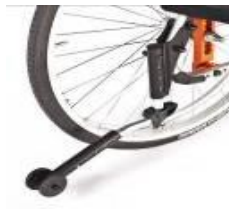
Kółko antywywrotne, odchylane, lewe