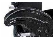
Osłona boczna z włókna węglowego z błotnikiem (czarna)