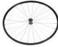
Koło lekkie, 24 szprychy, splot prosty