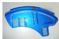
Aluminiowa osłona boczna z błotnikiem (w kolorze ramy)