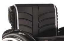
Tapicerka EXO standardowa