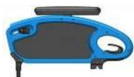
Podłokietnik przystolkowy ze stałą wysokością