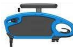
Podłokietnik przystolkowy z reg. wysokości