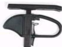
Podłokietnik na słupku z reg. wysokości