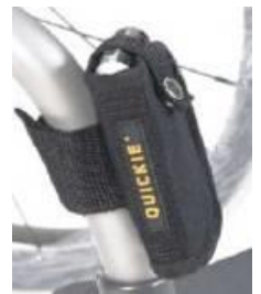
Kieszka na telefon