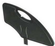
Plastikowana zdejmowana osłona boczna (czarna)