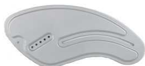
Aluminiowa osłona boczna (w kolorze ramy)