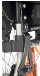
Oparcie z reg. kąta