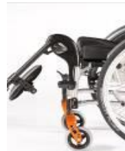
Unoszone ramię podnóżka (ELR)