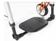
Platforma lekka, plastikowa, z reg. kąta i głębokości