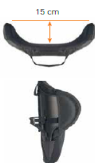
Oparcie Jay 3 głęboki kontur