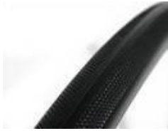
Opona odporna na przebicia