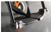
Dzielone podnóżki plastikowe, z reg. kąta, składane na boki, czarne