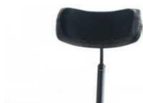
Zagiówek z reg. wysokości, głębokości i kąta