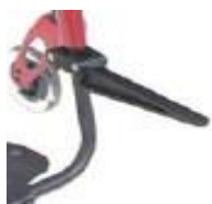
Uchwyt na torby