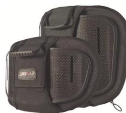
Oparcie Jay 3 Carbon płytki kontur