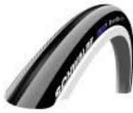
Opona pneumatyczna, gładki bieżnik, Schwalbe