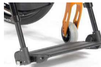
Platforma aluminiowa, z reg. kąta, składana na bok, czarna