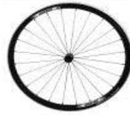
Koło Proton, 24 szprychy, splot prosty