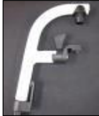
Aluminiowe ramię podnóżka 110°/100°