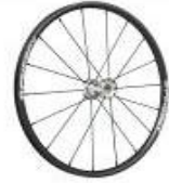
Koło Spinergy, 18 szprych, splot prosty