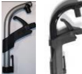
Plastikowe ramię podnóżka 110°/100°