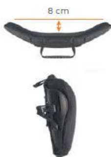
Oparcie Jay 3 średni kontur