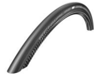
Opona pneumatyczna, Schwalbe One