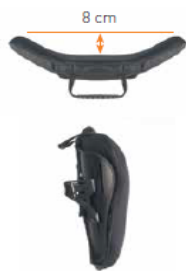
Oparcie Jay 3 Średni kontur