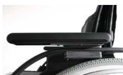
Podłokietnik z reg. wysokości przy pomocy narzędzi