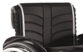
LI030316 Tapicerka EXO standardowa