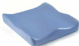
Jay Soft Combi P (zdjęcie nie pokazuje tapicerki)