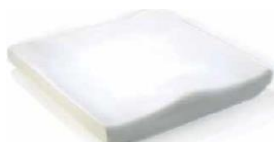
Jay Basic (zdjęcie nie pokazuje tapicerki)