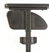
Podłokietnik na słupku z reg. wysokości przy pomocy narzędzi