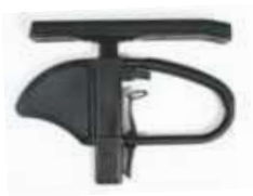
Podłokietnik na słupku z reg. wysokości