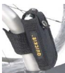
Kieszonka na telefon