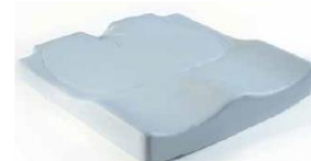
Jay Easy Visco (zdjęcie nie pokazuje tapicerki)