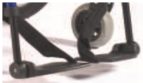
Podzielone plastikowe platformy podnóżka z reg. kąta