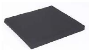
Poduszka na siedzisko z czarnym pokrowcem na suwak