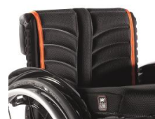
LI030317 Tapicerka EXO PRO oddechająca