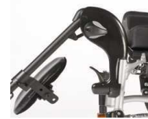
Unoszone ramię podnóżka