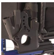
Oparcie z regulacją kąta