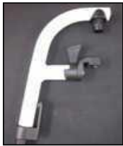
Aluminiowe ramię podnóżka