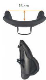
Oparcie Jay 3 Środkowy głęboki kontur