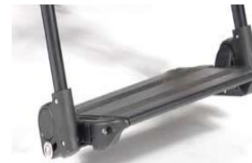
Aluminiowa platforma z reg. kąta i głębokości, podnoszona