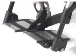
Aluminiowe podzielone platformy podnóżka z reg. kąta i głębokości