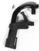
Plastikowe ramię podnóżka