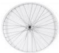
Uniwersalne koło ze splotem krzyżowym