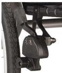
Hamulec z dźwignią na wys. kolan