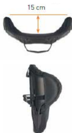
Oparcie Jay 3 Głęboki kontur