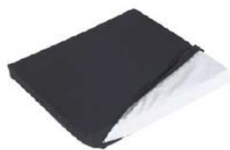
Poduszka na siedzisko, pokrowiec membranowy z suwakiem, czarna